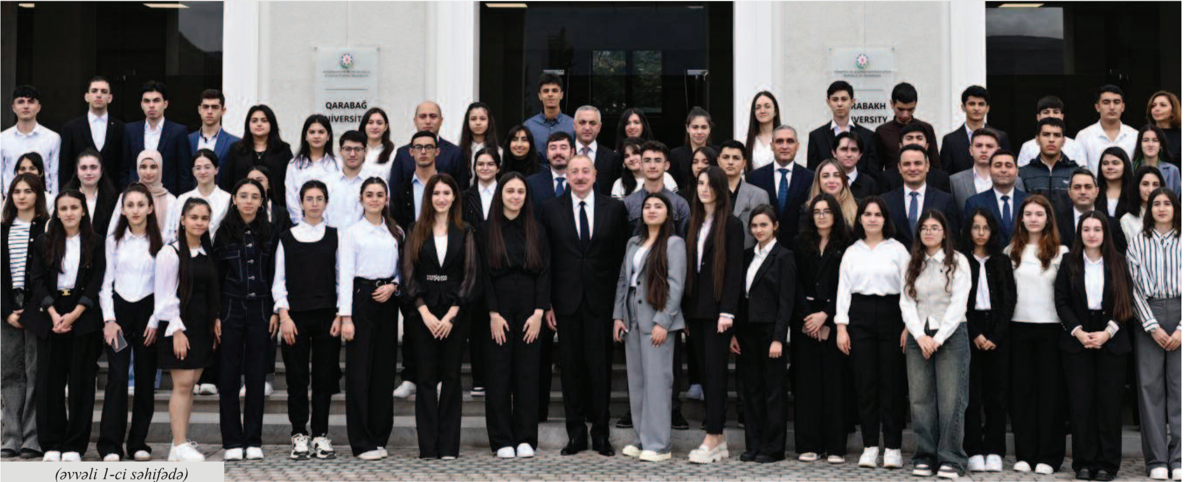
(əvvəli 1-ci səhifədə)